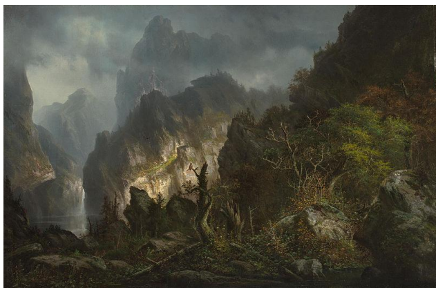
Abbildung von Hermann Ottomar Herzog : „Storm in the mountains“ unter Public Domain ( https://creativecommons.org/publicdomain/mark/1.0/ ).

Die Hochlage ist frei von Bäumen und dauerhaft schneebedeckt. Der Wind pfeift einem unablässig um die Nase und ist wahrhaft eisig. Starke Stürme sind hier noch wesentlich häufiger als auf dem Rest der Insel und werden in der Regel von Schneeregen oder gar Hagel begleitet. Der Wanderweg ist nur noch schwer erkennbar und schlecht ausgebaut. Man trifft nur noch sehr selten andere Pilger, denn viele kehren spätestens hier um, ohne je die Spitze erreicht zu haben.