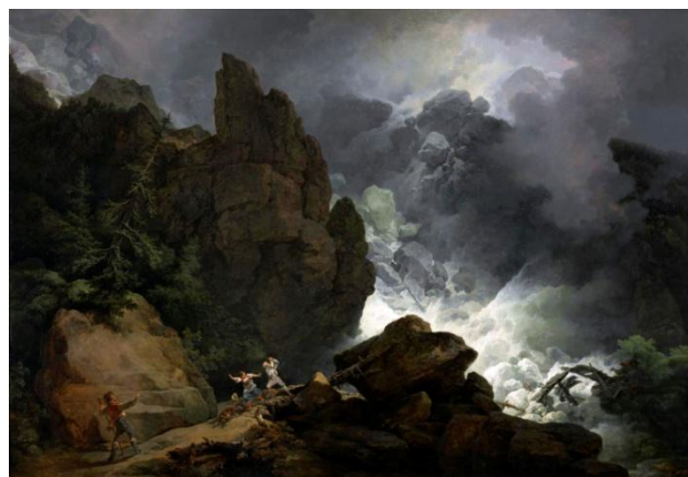
Abbildung von Philip James de Loutherbourg: „Avalanche dans les Alpes“ unter Public Domain ( https://creativecommons.org/publicdomain/mark/1.0/ ).